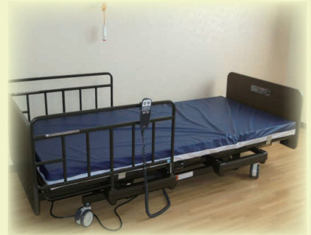
介護3モーターベッド