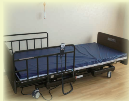
介護3モーターベッド